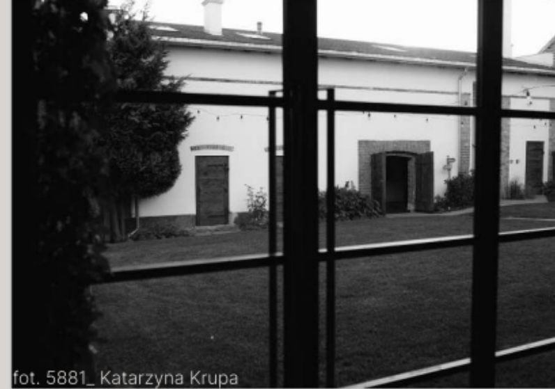
fot. 5881_ Katarzyna Krupa